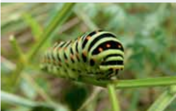
Foto: Schwalbenschwanz, Naturschutzgebiet Eichkogel

Der Fotowettbewerb findet in den Monaten Mai und Juni statt. Die Fotos können schon vorher gemacht worden sein, aber in diesem Zeitraum sollen sie in Wikimedia Commons, dem Bildspeicher der Wikipedia, hochgeladen werden. Am besten macht man das über die Listen, die in der Wikipedia für alle Naturdenkmäler und Schutzgebiete angelegt worden sind. Bitte die Beschreibung der Bilder nicht vergessen!